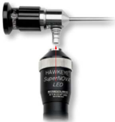
Abb. 1 Aufschrauben der LED-Lampe auf ein Endoskop