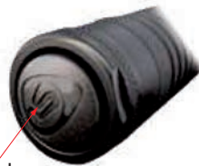
Fig. 7 Multi-function push-button