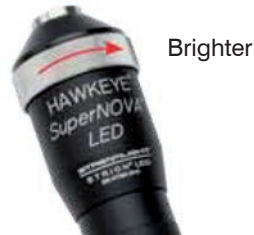
Abb. 9 Adjust light intensity