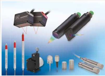
Capteurs et systèmes pour le déplacement, la distance et la position