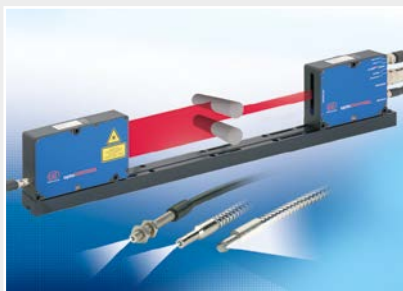
Micromètres optiques, guides d'onde optique, amplificateurs de mesure