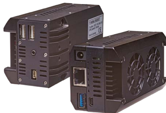
thermoIMAGER TIM NetBox