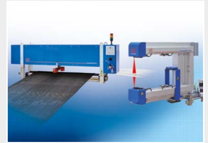
Systèmes de mesure et d'inspection pour les métaux, le plastique et le caoutchouc