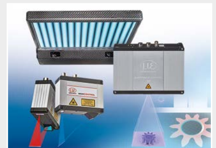
Mesure 3D pour l'inspection dimensionnelle et l'inspection de surface